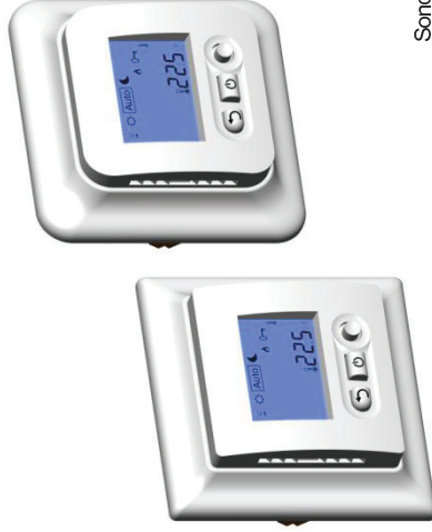
Sonde externe 10kΩ